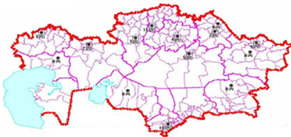
Рисунок 1 - Могильники пестицидов Казахстана

Однако представленная информация не обеспечивает полного и достоверного представления о характере и уровне загрязнения пестицидами всех земель Казахстана. Это препятствует разработке и реализации необходимых мер, направленных на безопасное уничтожение пестицидов и вывод их из оборота.