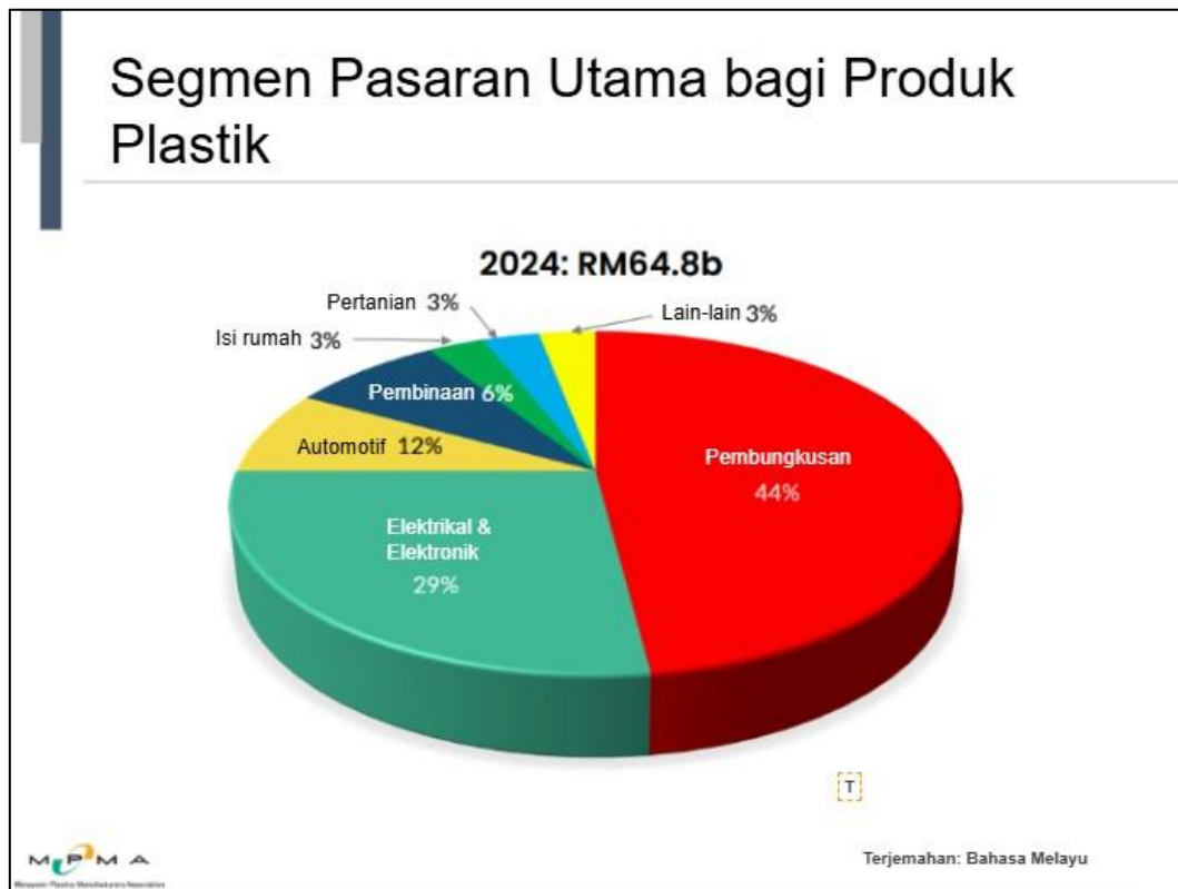
Segmen Pasaran Utama bagi Produk Plastik di Malaysia pada 2024

pembungkusan plastik, daripada yang tegar (contohnya botol, bekas, dan lain-lain) kepada fleksibel (contohnya beg plastik, pembalut shrink wrap, dan sebagainya) untuk kegunaan komersial dan perindustrian. 4